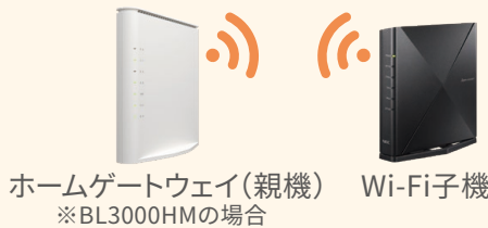
ホームゲートウェイ(親機) Wi-Fi子機 ※BL3000HMの場合